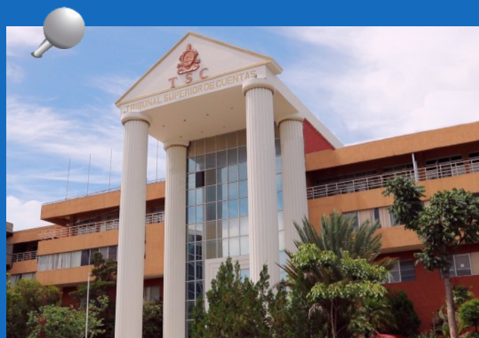
El Tribunal Superior de Cuentas (TSC) arribó a 21 años de ser el ente rector del sistema de control de los recursos públicos del Estado de Honduras

El TSC afianza en cada año su rol fiscalizador con base a la normativa nacional e internacional, con la guía definida en el Plan Estratégico Institucional 2019-2024, desarrollado eficaz y eficientemente por el personal administrativo y operativo que la compone.