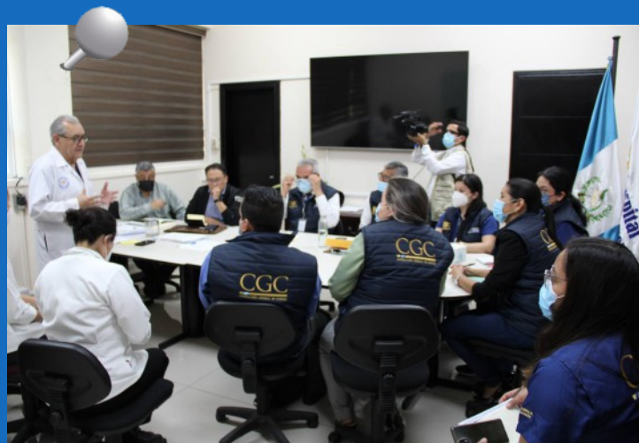
Auditores del Programa Departamento de Calidad se reúnen con autoridades del Hospital Roosevelt.