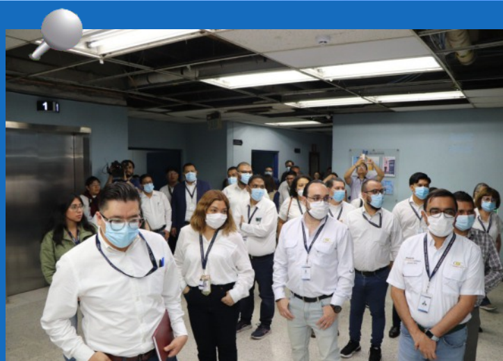
Personal del Programa Municipio Fiscalizado se ubican en el Hospital General San Juan de Dios para monitoreo las diferentes áreas del centro asistencial

Es preciso resaltar que el programa no contempla la realización de auditorías que deriven en algún tipo de acción legal, sino que se enfoca específicamente en el monitoreo que permita obtener información oportuna sobre los servicios públicos que prestan las instituciones del Estado en los municipios del país.