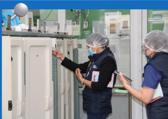
Los auditores del Programa Departamento de Calidad verifican el buen estado de los alimentos en el Hospital Roosevelt. (Foto: CGC).

Las acciones se dan en el marco de la estrategia de prevención contra la corrupción, impulsada por el Dr. Bode Fuentes, y que tiene como prioridad la mejora en la prestación de servicios que las Instituciones del Estado brindan a la ciudadanía en los 22 departamentos del país.