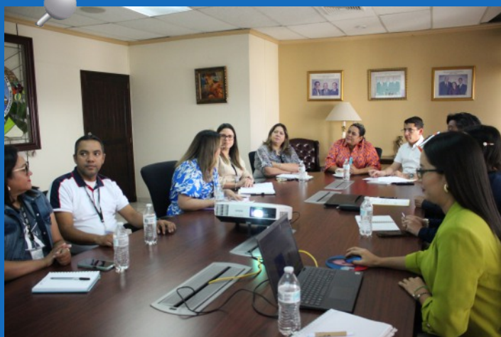
El Pleno del TSC en una reunión de trabajo con diversas áreas de la Institución, en el marco del inicio de la plataforma Moodle, una innovadora propuesta de campus virtual orientado a brindar capacitaciones en línea sobre el MARCI y otras materias.

Asimismo, se elaboró el diseño de 5 de los 6 módulos de curso de MARCI, que consisten en Marco Conceptual del Control Interno, Información General del MARCI, Componentes “Entorno de Control, sus Principios y Normas”, “Evaluación de Riesgos, sus Principios y Normas” y “Actividades de Control sus Principios y Normas”.