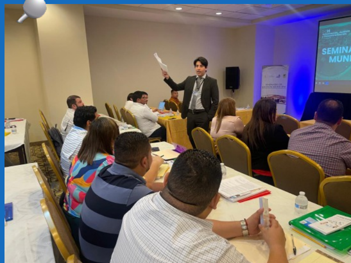
TSC inicia amplio programa de capacitación dirigido a personal de las 298 Municipalidades del país con el propósito de afianzar la cultura de transparencia y rendición de cuentas.

El TSC enfoca sus acciones en prevenir y combatir la corrupción; promoviendo el buen manejo de las cuentas públicas, mediante un efectivo mecanismo de control, apegado a la objetividad, responsabilidad, imparcialidad y capacidad.