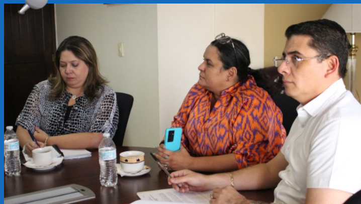
El Pleno de Magistrados destacó la importancia de contar con una nueva plataforma, emprendiendo un paso importante en la enseñanza virtual, fortaleciendo las capacidades operativas y administrativas.