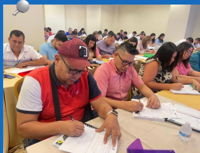
El “Seminario de Fortalecimiento de la Gestión Municipal 2024” se ofrecerá de julio a noviembre, período en el cual se desarrollarán 17 jornadas a nivel nacional, dirigido a Jefes de Contabilidad y Presupuesto, Tesoreros y Jefes de Catastro de las alcaldías del país.