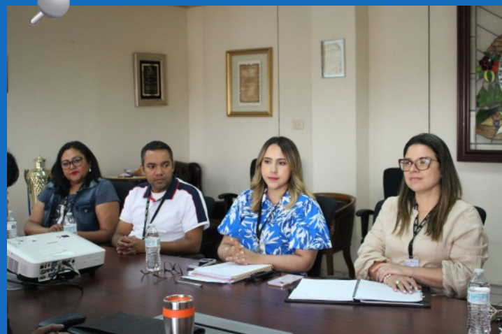
En la reunión participaron representantes de la Unidad de Gestión de Proyectos, Departamento de Formación de Personal, Gerencia de Tecnología y Dirección de Comunicación Institucional.